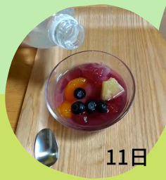
11日 しゅわしゅわフルーツポンチ & 父の日カード