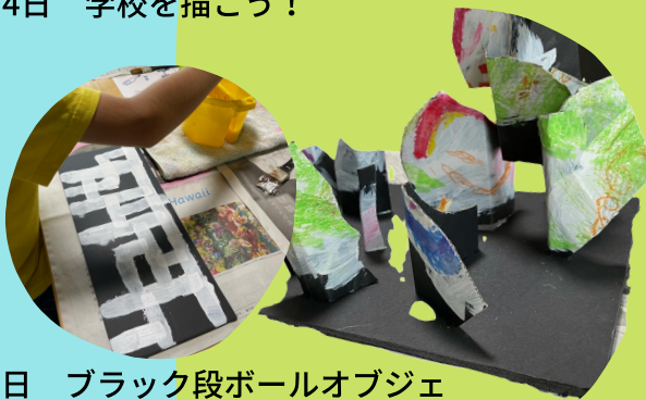
18日 ブラック段ボールオブジェ