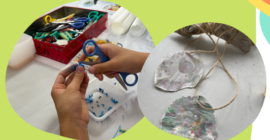
28日 クレヨンサンキャッチャー

マイシアター会員はもちろん、お友達もお誘いして楽しみましょう！ お問い合わせは マイシアター高松 087-868-2251